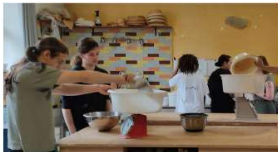
Initiation à la boulangerie