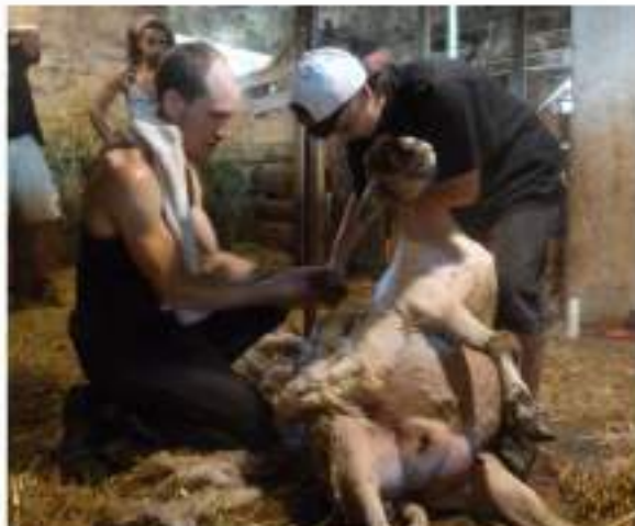
Entretien de vignes, ou tonte des moutons chez des fermes partenaires