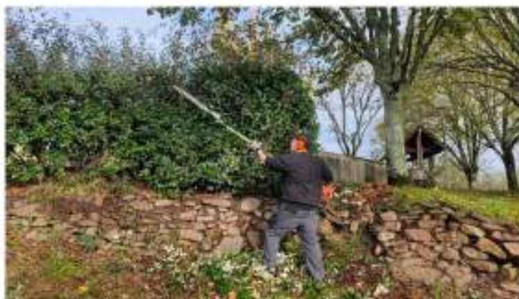
Entretien des espaces verts de Mergieux