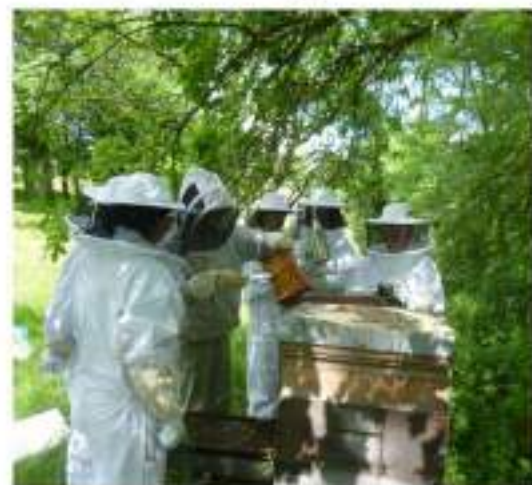
Installation et entretien du rucher de Mergieux