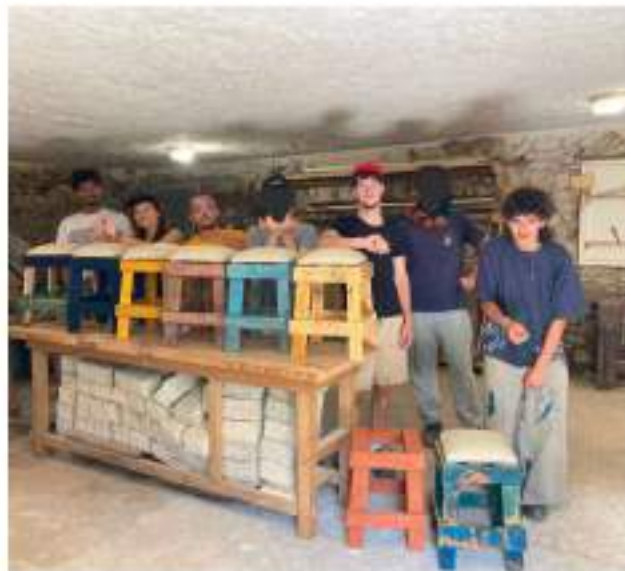
Fabrication d'un tabouret en matériaux de réemploi et locaux

Dans nos formations découverte, les stagiaires découvrent une belle diversité de métiers au rythme de 1 jour/1 chantier. Nous complétons cette approche d'animation sur la Transition Ecologique.