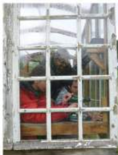
Réparation de la serre volante