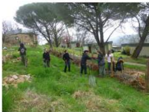
Construction d'une haie sèche