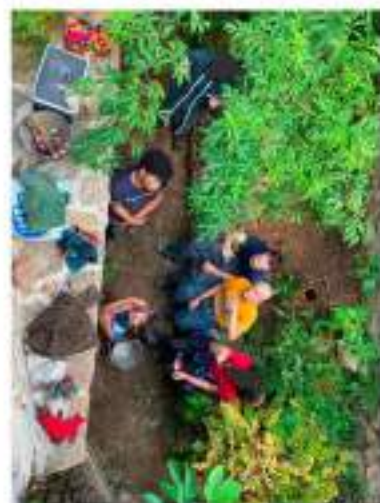
Construction en pierres sèches